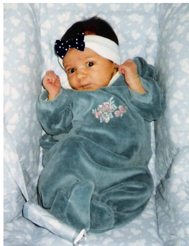
15 jours. Quel beau bébé !