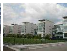
A 3 minutes à pied de l' université Saint Serge