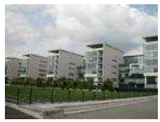
3 minutes à pied de l'université Saint Serge