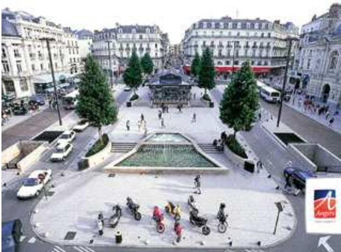
A 4 minutes à pied du Cœur de la ville, la place du Ralliement