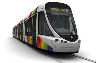
Ligne du futur Tram dans la rue adjacente Station "Saint Serge Université"