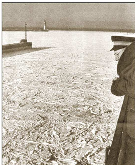
Le port de Dunkerque complètement gelé...

Les 5 et 6 février , le Languedoc-Roussillon est enseveli sous une extraordinaire tempête de neige. Il tombe 85 cm de neige en 2 jours à Perpignan mais également une quarantaine de centimètres à Carcassonne et 30 cm à Montpellier.